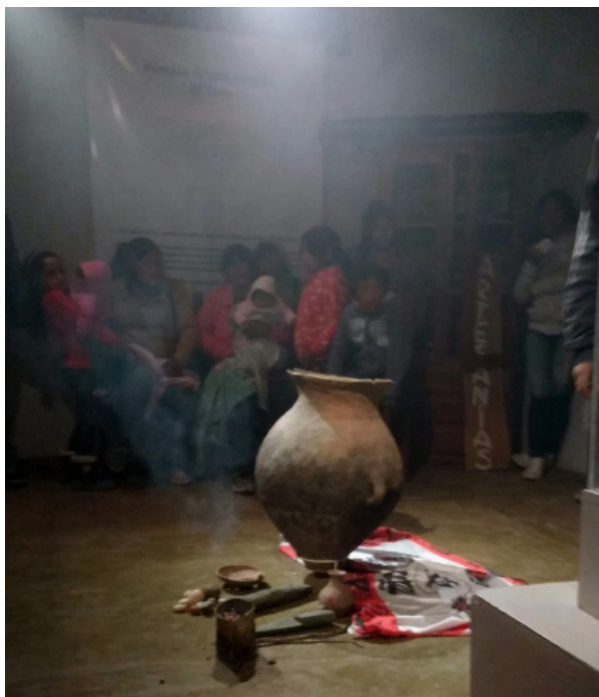
Figura 5: Momento en el que las piezas del sitio Loma del Oratorio pasan a ser exhibidas en el centro de interpretación Parque Arqueológico El Tero.