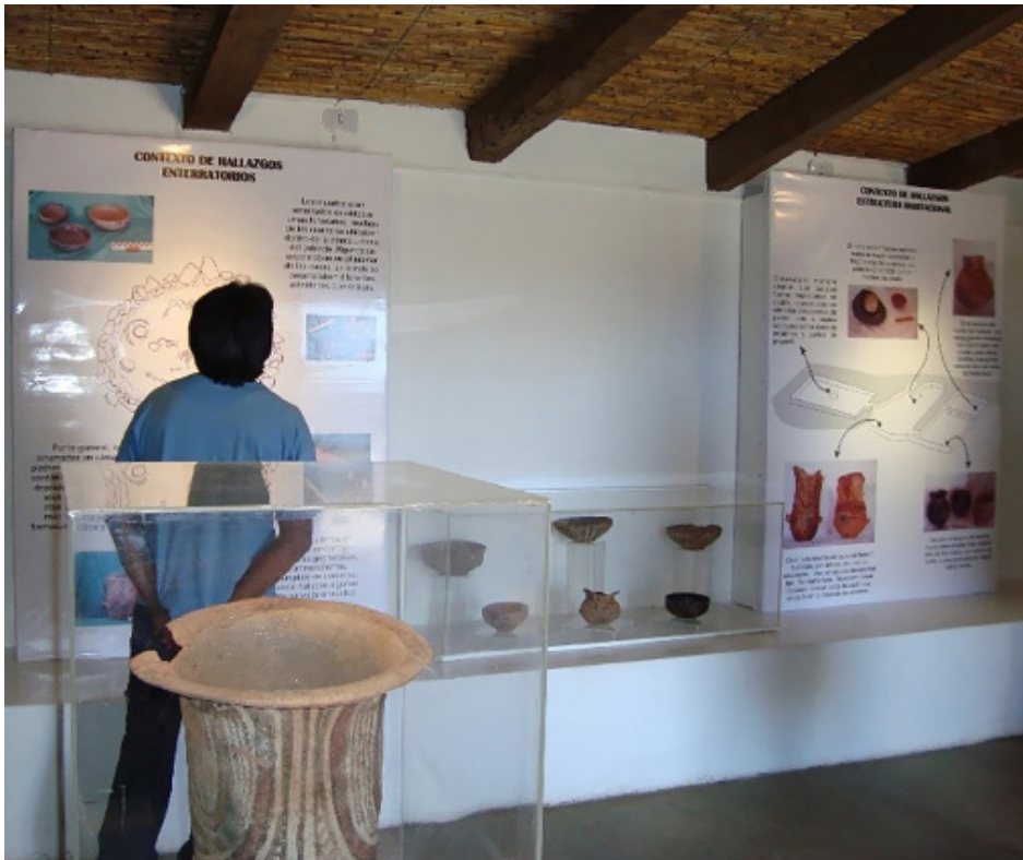
Figura 3: Puesta museográfica del centro de interpretación El Tero, año 2010.

la vez de diseñar una estrategia de comercialización que permitiera mejorar los ingresos y solventar el funcionamiento. Así, se logró acondicionar el centro de interpretación en el que se alojaban diferentes objetos arqueológicos recuperados en el sitio durante las primeras excavaciones en la década de 1970 (Figura 3 y 4). Su inauguración en el año 2010 permitió concretar uno de los primeros Ecomuseos de Desarrollo Comunitario en el pueblo de Cachi (Montenegro & Rivolta, 2013). Siguiendo la propuesta de De Carli (2006), la creación del centro de interpretación del Parque Arqueológico El Tero llevó a que la población local, es decir los vecinos del barrio, se pudieran incorporar a la acción, dejando de ser público o espectadores, para convertirse en actores de su propio museo. Resulta interesante destacar el apoyo de gran cantidad de vecinos, quienes colaboraron con trabajo para el armado del parque.