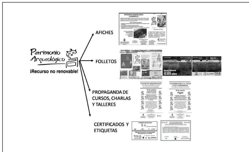
Figura 4. Marca Regional, creada e instaurada en el marco de los proyectos de extensión, sobre distintos tipos de soporte.

Sur), dependiente del Centro de Registro del Patrimonio Arqueológico y Paleontológico de la Dirección Provincial de Patrimonio Cultural (ICGPBA), y que trabaja en los partidos involucrados en los proyectos de extensión, en los cuales la Dirección Provincial de Patrimonio Cultural está involucrada como institución copartícipe.